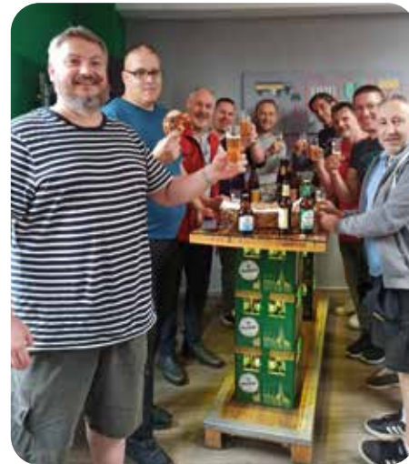
tusFBAH bei der Brauerei Höpfner

Unser Highlight war jedoch das berühmte Kräusen, das mit seiner natürlichen Trübung und seinem vollen Geschmack überzeugte. Die Zeit verging wie im Fluge, und so nutzten wir den Nachmittag, um den nebenan liegenden Biergarten zu erkunden.