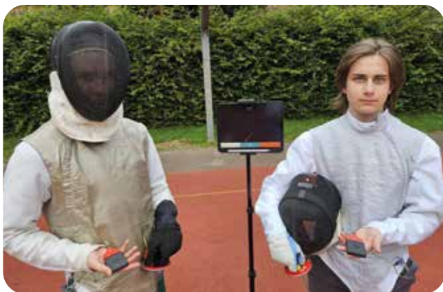
Kabelloses Fechten: Ein Tablet oder Smartphone und zwei kleine Sender. Das kann auch auf dem Hartplatz vor der Halle stattfinden.

Davon profitieren vor allem die Florettfechter, welche die Mehrheit der Trainierenden stellen. Dafür werden bis zu vier Meldegeräte benötigt und hinzu kommen dann noch weitere für die Säbel- und Degenfechter. Da wird es manchmal eng, wenn zum Beispiel 19 Florettfechter und Fechterinnen in turniermäßigen Runden zu viert oder fünft 44 Gefechte durchführen müssen. Nach einem erfolgreichen Testbetrieb im Herbst 2023 konnten wir dank Sponsoren drei kabellose Melder erwerben. Die Vorteile haben sich sehr schnell gezeigt: Zeitersparnis durch weniger Aufbau, schnellerer Wechsel der Fechter und keine Fehlersuche mehr bei den Kabeln und Rollen. Statt wie sonst in 90 Minuten für 15 Gefechte mit sechs Fechtern war die Runde bereits nach weniger als einer Stunde fertig! Und noch ein Vorteil: Bei heißem Wetter können die Fechter aus der etwas stickigen Halle damit auch auf den Hartplatz daneben ausweichen!