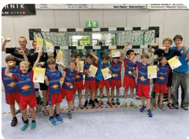
E Jugend mit Spaß und Erfolg auf Bezirksspielfest

In der dritten Bezirksklasse hat die D2 auf jeden Fall den Anspruch, oben mitzuspielen und auch den Jüngeren aus der E-Jugend die erste Spielzeit in der D-Jugend zu ermöglichen.