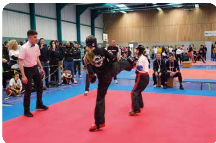
Landesmeisterschaft der WAKO Baden-Württemberg S. 34

Redaktionsschluss nächster Sportspiegel: Dienstag, 15.10.2024