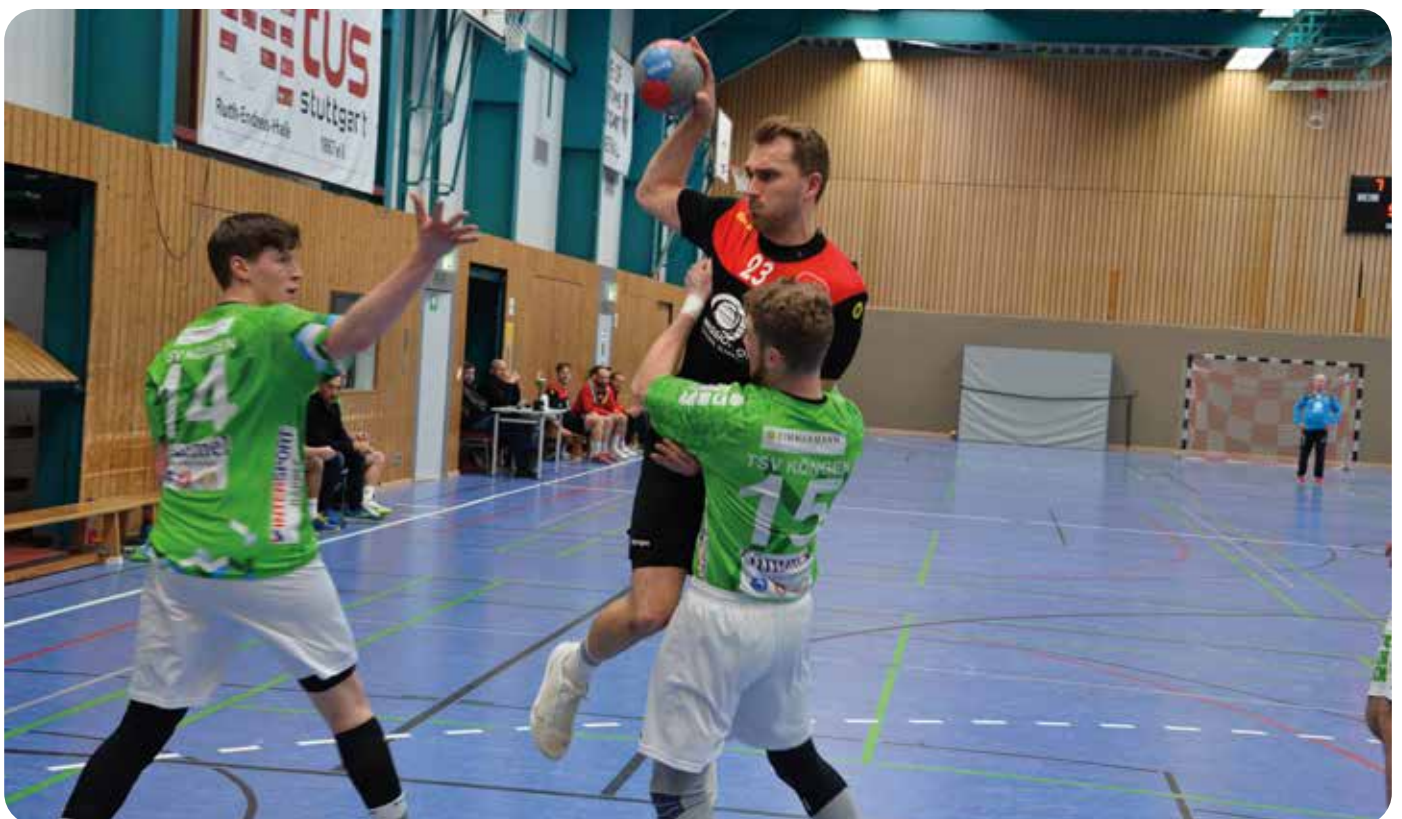
M1 nur schwer aufzuhalten!

Alles in allem stimmen also ca. zwei Monate vor Saisonstart die Vorzeichen. Wir blicken der neuen Saison voller Vorfreude entgegen. Ab Ende September brauchen wir wieder jede erdenkliche Unterstützung in der Ruth-Endress-Sporthalle, dem Wohnzimmer der tus Handballer. Mit eurem lautstarken Support wollen wir die Oberliga so richtig aufmischen und möglichst viele Punkte sammeln. In diesem Sinne: Auf die Turmsler.