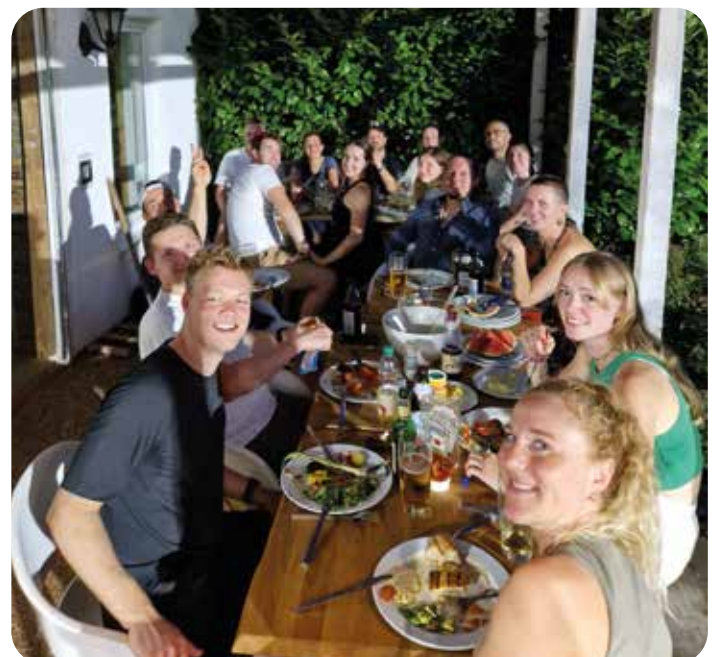
Das ist Verein-die Damen 1 feiern mit den Herren 30 unter dem Sportalm-Vordach