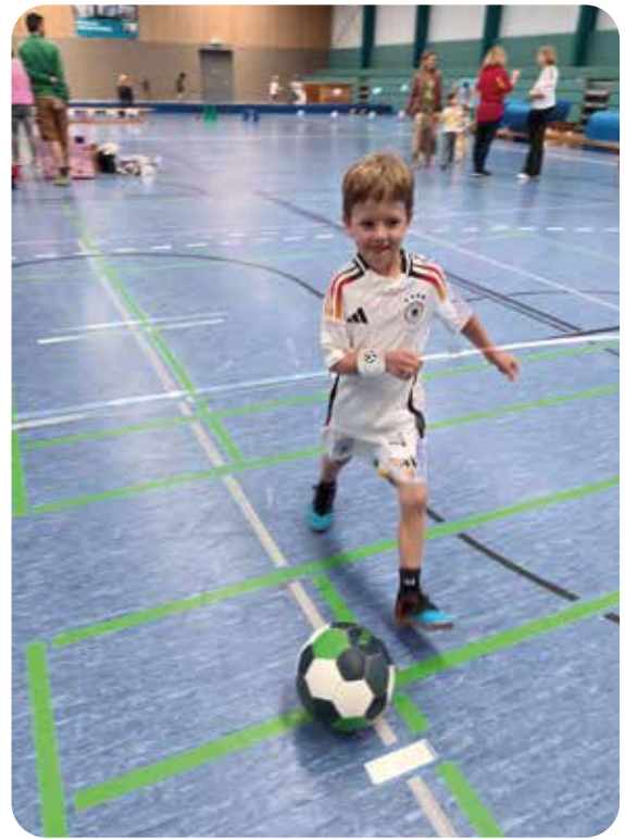
Kicken wie ein Profi