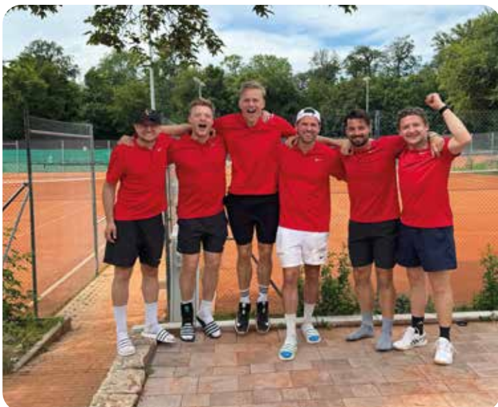
Herren 30 nach dem 9:0 Sieg gegen Muckensturm