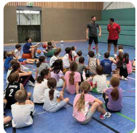
Sommer-SpoWo 2024: alle lauschen gespannt