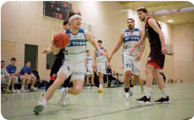
Herren 1 im Angriff

Die PKF Titans Stuttgart haben eine herausfordernde Saison in der 2. Regionalliga BW hinter sich gebracht. Trotz zahlreicher Hindernisse und Rückschläge konnte sich das Team den 11. Platz sichern. Mit einer Bilanz von 9 Siegen und 17 Niederlagen ist es den Titans gelungen, den Klassenerhalt zu schaffen und weiterhin in der Liga zu bleiben.