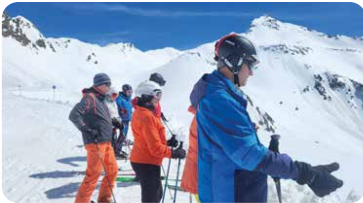
Es kann losgehen...

Bei unserer Saison-Abschluss-Skiausfahrt Mitte April im Ötztaler Skigebiet wurden wir mit tollem Wetter und super Schneeverhältnissen verwöhnt. Auf diese Ausfahrt ist einfach Verlass. Wie in den letzten Jahren auch, war bei diesem Saisonabschluss einfach wieder alles perfekt. Bei strahlendem Sonnenschein konnten wir die frisch verschneiten Pisten in vollen Zügen auskosten und nach der Mittageinkehr auch noch eine Weile den traumhaften Ausblick auf die umliegenden Gipfel in der Sonne genießen. Auch in unserem Stammhotel hat wieder alles gepasst – tolles Team, mega Frühstück und sehr leckeres Abendessen. Besser kann ein Ski-Wochenende nicht sein. Kein Wunder, dass die Stimmung wieder super war. Wir haben viel geplaudert, gescherzt und gelacht. Mit solch aufgetankten Batterien fährt man am Sonntagabend gerne wieder nach Hause und ist für die kommende Woche bestens gerüstet. Ein rundum gelungener Saisonabschluss!