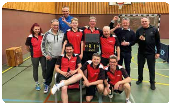
Heimsieg mit Fans am 19.4.24