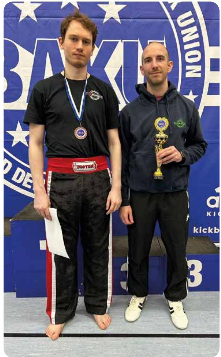
Unsere Kämpfer auf dem Offenen Bayernpokal 2024

Am 20. April 2024 fand die Landesmeisterschaft der WAKO Baden-Württemberg e.V. statt. Der Austragungsort war die Ruth-Endress-Halle auf dem Gelände des tus Stuttgart. Die Meisterschaft war ein wichtiges Ereignis für die Kampfsportler in Baden-Württemberg.