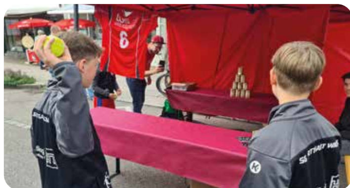
Degerlocher Sommer S. 8