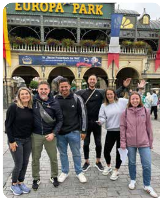
Das tus|kids Team im Europa-Park

Für Kinder zwischen 3 und 5 Jahren bieten wir den kids|TobePark an. Kinder können hier mit Mama und Papa die ersten turnerischen Bewegungserfahrungen sammeln. Eine Schnupperstunde ist kostenlos möglich. Wenn es Ihnen gefallen hat und Sie sich entschieden haben, können Sie eine 10er Karte oder eine Mitgliedschaft beantragen. Beides erhalten Sie vor Ort beim Sportlehrer nach der Stunde.