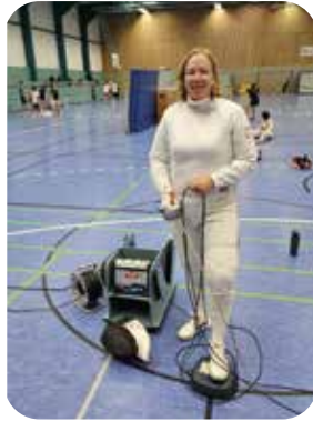
Elektrisches Fechten bisher: Ein Meldegerät, zwei Kabelrollen und viel Kabel

„Elektrisches Fechten ist ja wie eine Kombination aus Deckenzuglampe und Klingelknopf!“ hat einmal ein aufmerksamer Beobachter festgestellt, als die Fechter auf der Planche an einem durch Rollen gespannten Kabel hängend ihre Treffer setzten, ausgelöst durch einen kleinen Druckknopf an der Klingenspitze und angezeigt am Meldegerät. Dieses ist wiederum durch weitere Kabel mit den Rollen verbunden. Ein zeitaufwändiger Auf- und Abbau, dazu das An- und Abnabeln beim Wechsel der Fechter zwischen den Gefechten und manchmal auch eine mühsame und frustrierende Fehlersuche bei so vielen Elementen... Seit Ende 2023 können unsere Fechter jetzt auch kabellos fechten. Dafür benötigt man heutzutage nur noch ein Smartphone oder Tablet mit einer Fechtapp und für jeden Fechter einen kleinen Sender in der Hosentasche. Der mühsame Aufbau von Meldegerät, Kabeln und Rollen entfällt und der Fechter ist vom gespannten Kabel befreit. Das ist bei der Organisation unseres Trainings eine große Hilfe, insbesondere wenn viele Fechter am Training teilnehmen. Denn die Anzahl der herkömmlichen Meldegeräte, die in unserer Halle aufgebaut werden können, ist begrenzt und der Wechsel zwischen den Gefechten benötigt seine Zeit. Seit knapp zwei Jahren sind unsere Trainingsabende so organisiert, dass in den letzten sechzig Minuten Runden wie richtige Wettkämpfe gefochten werden.