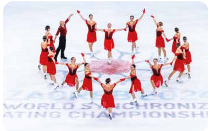
United Angels©International Skating Union