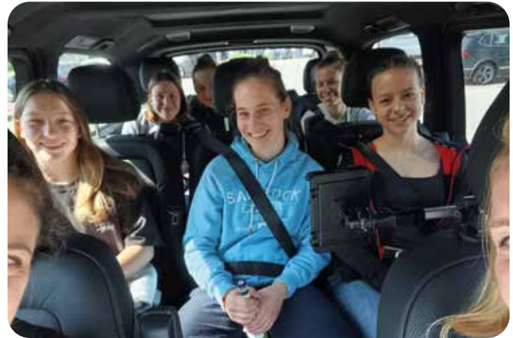
Auf großer Fahrt!

Die Sportstätten lagen sehr nah beieinander, so dass wir alles zu Fuß erreichen konnten. Wir beendeten gegen 14 Uhr unseren Wettkampf mit einer tollen Tanz Choreografie. Wir freuten uns über unsere Leistungen und Ergebnisse, auch wenn die Kampfrichter sehr streng bewertet haben. Nach einer Erholungspause am Nachmittag hatten wir eine tolle Show der Sieger am Abend. Über 1000 Teilnehmer waren vertreten und die Stimmung war spitze.