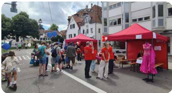
Der Stand der tus Stuttgart beim Degerlocher Sommer 2024