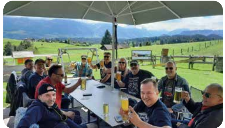
tusFBAH in Sonthofen

in den Wintermonaten, die uns dazu zwingen die Gruppen in festen Größen zu halten. Wir arbeiten daran... Anfang Juli hatte die Fußball Abteilungsleitung Kontakt zu den Stuttgarter Kickers die neuen Konzepte im Jugendfußball über Vereinsgrenzen vorstellen zu wollen (Fußball Camps, Mädchenförderung). Dazu soll es im Herbst eine Veranstaltung geben. Die tus Fußball Abteilung wird sich diese Konzepte anhören und schauen, ob es einen Synergieeffekt für unsere Fußball Jugend bringt.