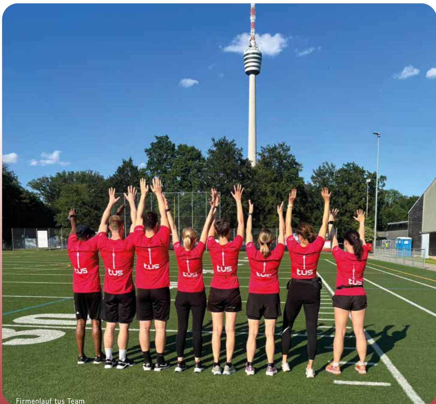
Firmenlauf tus Team

TURNIERSIEG DER U19 TISCHTENNIS ZWEIERMANNSCHAFT