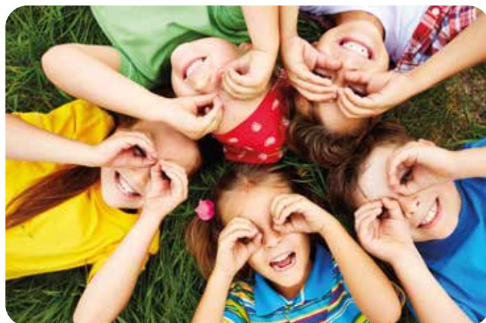
Sportprogramm für Kinder und Jugendliche S. 19