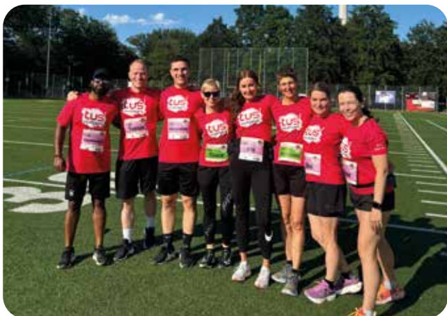
Das tus-Team beim AOK Firmenlauf

Am 14. Mai 2024 fand der jährliche AOK Firmenlauf in Stuttgart statt, an dem das erste Mal eine motivierte Gruppe von Mitarbeitern des tus Stuttgart teilnahm. Der AOK Firmenlauf, bekannt für seine positive Atmosphäre und das gemeinsame sportliche Erlebnis, bot unseren Mitarbeitern eine großartige Gelegenheit, Teamgeist und Zusammenhalt zu stärken. Unser Team, bestand aus 8 sportbegeisterten Mitarbeitern, die in den Vereinsfarben rot, weiß und schwarz den tus Stuttgart repräsentierten.