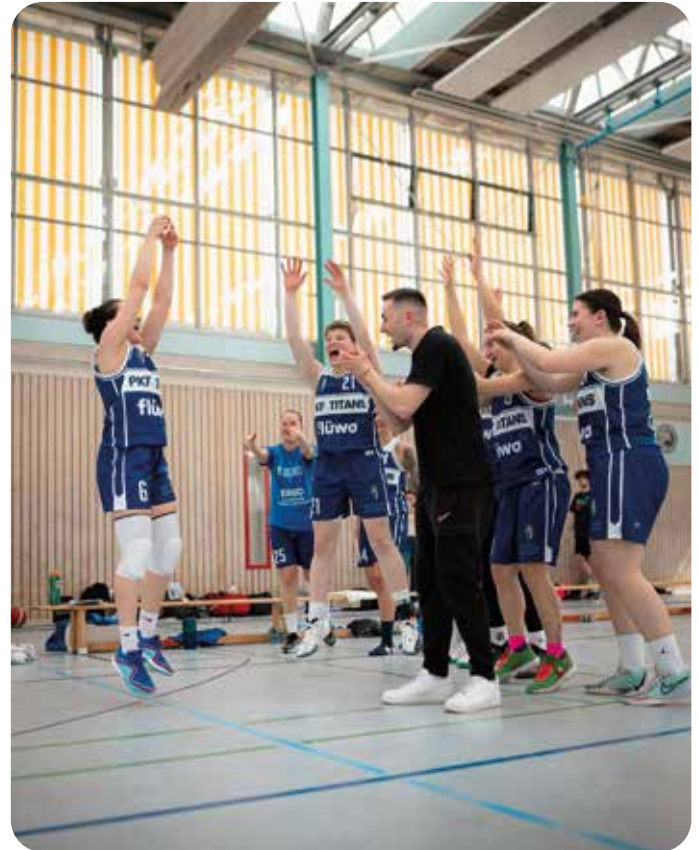
Die Damen freuen sich über den Pokalsieg