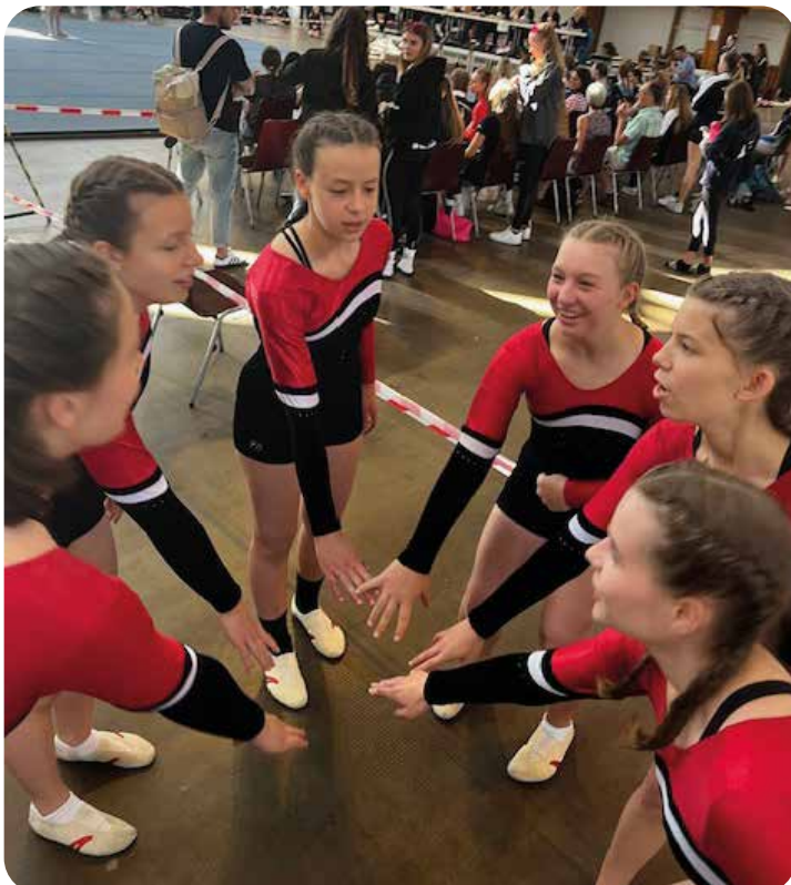
Teamspirit vor dem Turnen