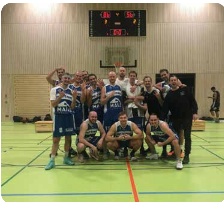
Die Herren 3