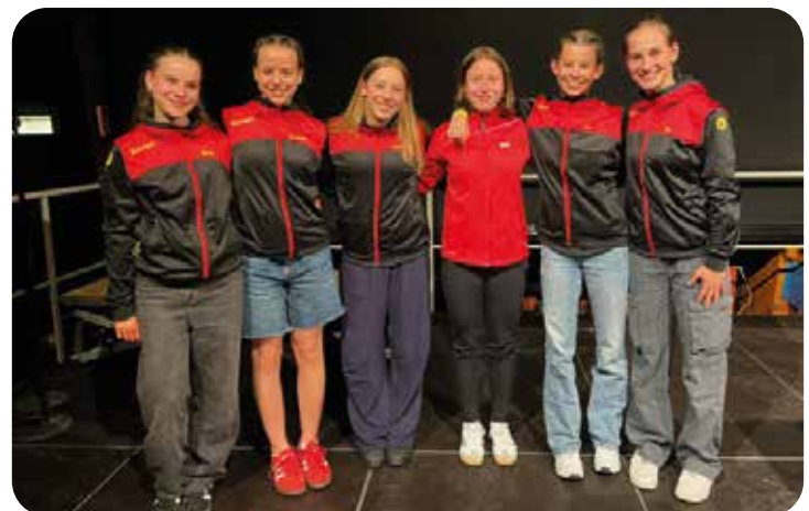
Die Polarfüchse bei der Deutschen Meisterschaft

Und unser Ergebnis war es auch: wir wurden 12. von 26. Mannschaften in unserer Kategorie TGW Junioren! Danach musste gefeiert werden, so dass wir spät am Abend todmüde ins Bett gefallen sind.