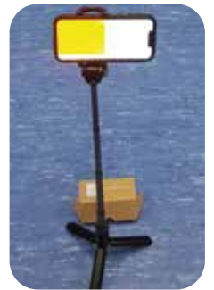
Die Tefferanzeige auf dem Handy mit akustischem Signal

Davon profitieren vor allem die Florettfechter, welche die Mehrheit der Trainierenden stellen. Dafür werden bis zu vier Meldegeräte benötigt und hinzu kommen dann noch weitere für die Säbel- und Degenfechter. Da wird es manchmal eng, wenn zum Beispiel 19 Florettfechter und Fechterinnen in turniermäßigen Runden zu viert oder fünft 44 Gefechte durchführen müssen. Nach einem erfolgreichen Testbetrieb im Herbst 2023 konnten wir dank Sponsoren drei kabellose Melder erwerben. Die Vorteile haben sich sehr schnell gezeigt: Zeitersparnis durch weniger Aufbau, schnellerer Wechsel der Fechter und keine Fehlersuche mehr bei den Kabeln und Rollen. Statt wie sonst in 90 Minuten für 15 Gefechte mit sechs Fechtern war die Runde bereits nach weniger als einer Stunde fertig! Und noch ein Vorteil: Bei heißem Wetter können die Fechter aus der etwas stickigen Halle damit auch auf den Hartplatz daneben ausweichen!