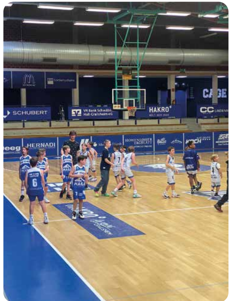
U10 in Crailsheim

Insgesamt 16 Teams umfasst die inzwischen auf über 300 Mitglieder angewachsene Basketballabteilung, der Spagat zwischen Spitzen- und Breitensport ist gelungen, mit großem Engagement hat er die Jugendarbeit und die beiden Regionalligateams im aktiven Bereich vorgebracht. Herausragend auch seine Zusammenarbeit mit unseren Sponsoren, die ja für unsere Arbeit existentiell wichtig sind. Ohne deren Engagement könnte diese Leistung nicht abliefern werden. Er hinterlässt eine große Lücke, die es ab sofort zu füllen gilt. Gottseidank ist er nicht aus der Welt und bleibt den Basketballern als Ansprechpartner und Sponsor erhalten. Wir freuen uns, wenn er in Zukunft, dann ohne Amt, in Ruhe unsere Spiele genießen kann.