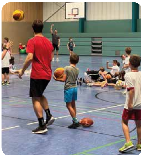
Sommer-SpoWo 2024 - Ballspiele