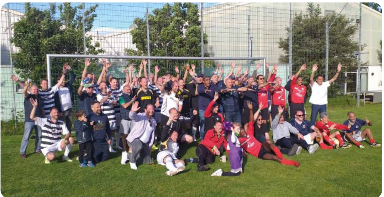
tusFBAH beim internationalen Turnier

Das Auftaktspiel gewannen die tus Alten Herren bei strahlendem Sonnenschein gegen die Riverside Dogs aus Schottland souverän mit 3:0. Darauf folgte das Lokal-Derby gegen die Sportsfreunde Stuttgart, die überraschend aber nicht unverdient mit 1:0 in Führung gingen. Doch die Routiniers des tus Stuttgart bewahrten die Nerven und erzwangen den Ausgleich, sodass sich die beiden Vereinsrivalen mit einem schwer umkämpften, letztlich jedoch angemessenen 1:1 trennten.