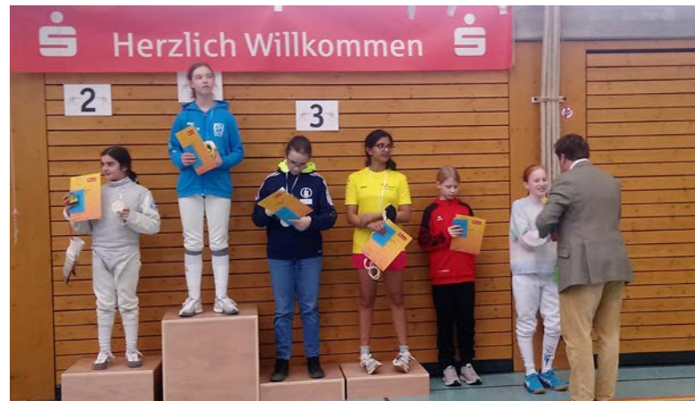
Überreichung durch Benjamin Detzer

teil und erhielt ihre Auszeichnung vom Präsident des Deutschen Fechterbundes, Benjamin Detzer höchstpersönlich entgegen. Sie belegte Platz 7.