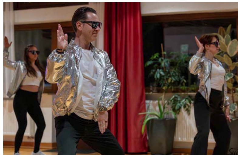
Casino Club Canstatt