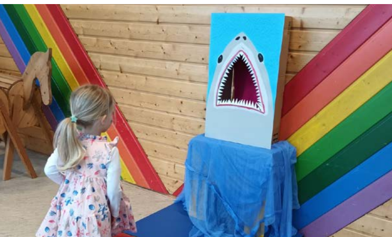
Kein gefährlicher Hai-Angriff

Schon am Morgen liefen kleine Piratinnen, mutige Kapitäne und schillernde Meerjungfrauen im Hafen ein. Im Toberaum warteten spannende Spielstationen auf die abenteuerlustigen Matrosinnen und Matrosen. An der Station „Planke wackeln“ balancierten die Kinder mutig über eine Turnbank – stets darauf bedacht, nicht in das „eiskalte Meer“ zu fallen. Und beim Haie Füttern war äußerste Vorsicht geboten.