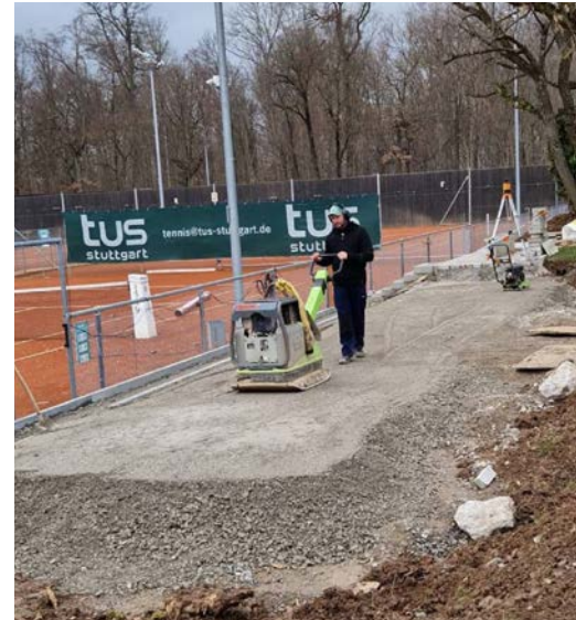
Die Bauarbeiten gehen voran