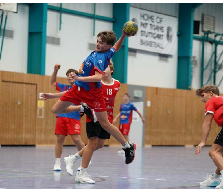
Tolle Entwicklungen unserer Jugendspieler