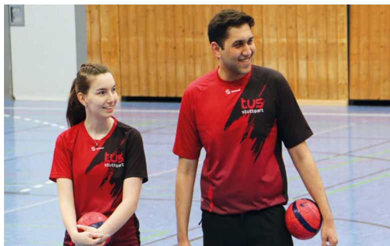
Trikot für Damen und Herren: 37,90 €. Für Kinder: 30,90 €