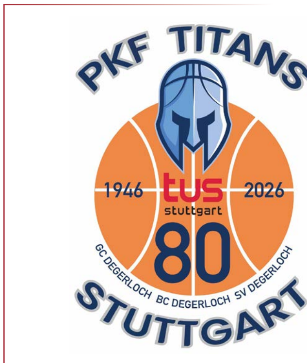
80 Jahre Basketball in Degerloch S. 41