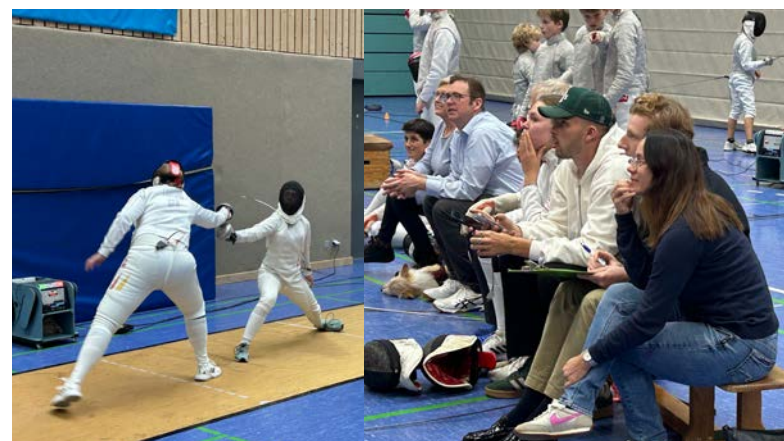
Das Publikum bekam spannende Kämpfe zu sehen