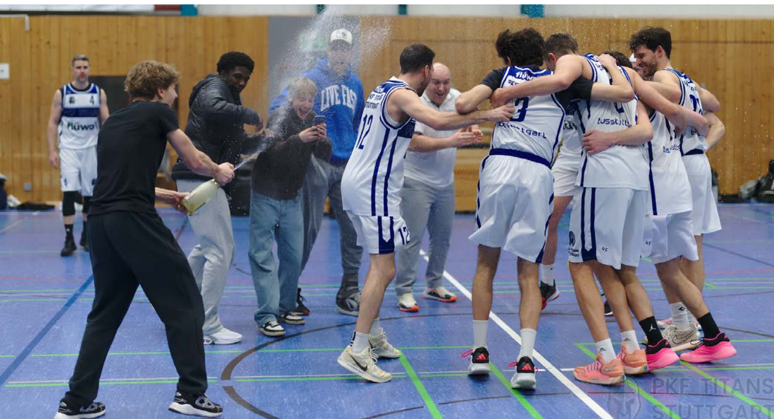
Die PKF Titans sind Meister und feiern ihren Aufstieg

Am Sonntag fand in Degerloch das entscheidende Spiel um die Meisterschaft der Regionalliga Baden-Württemberg 2025/26 statt. Die Basketball Abteilung des tus Stuttgart (PKF Titans), Tabellenführer vor diesem Spieltag, empfingen die Kirchheim Knights, den Zweitplatzierten der Liga.