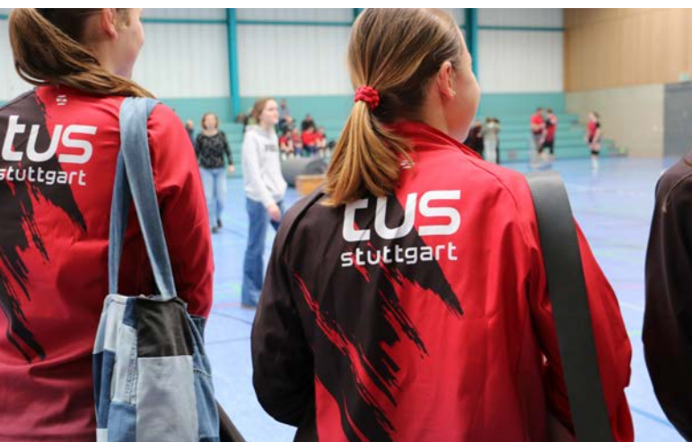
Jacke für Damen, Herren und Kinder: 57,90 €

Weitere Informationen zum Bestellprozess folgen.