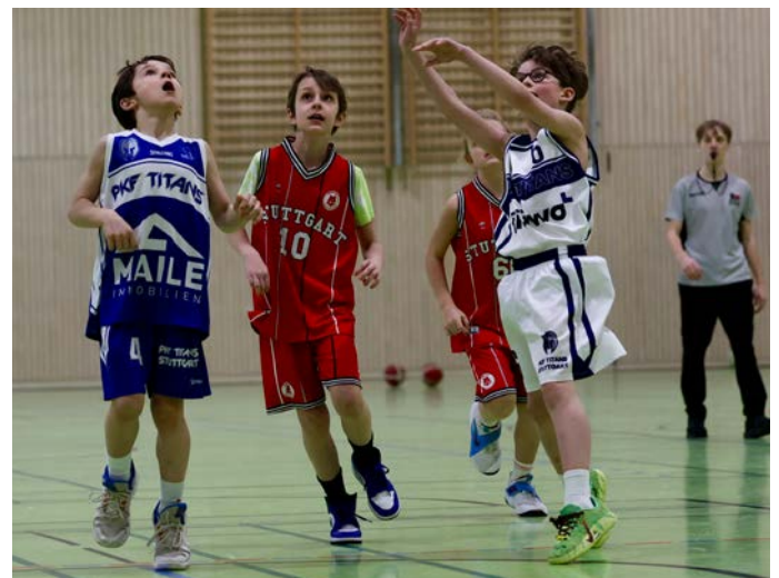
Die U10 beim Spiel gegen den MTV Stuttgart