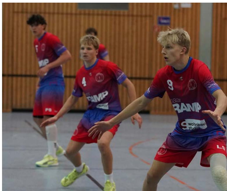
Für alles bereit: unsere B-Jugend