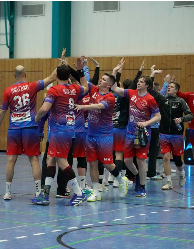
Starkes Team in neuen Trikots der Spielgemeinschaft Waldau