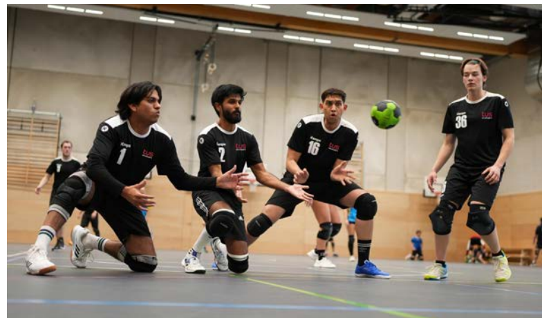
Klassische Verteidigung im Tchoukball

Die Teilnahme an der Deutschen Meisterschaft steht für Mut, Aufbauarbeit und neue Wege. Als erste Tchoukball-Mannschaft in Baden-Württemberg übernimmt das Team eine Pionierrolle und macht den Sport sichtbar.