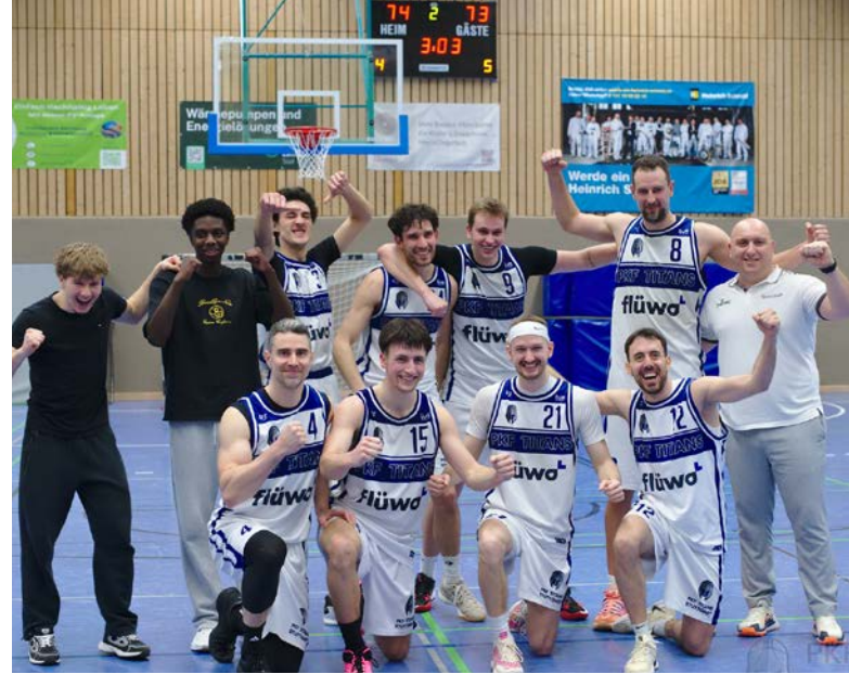
Meister der Regionalliga Baden-Württemberg