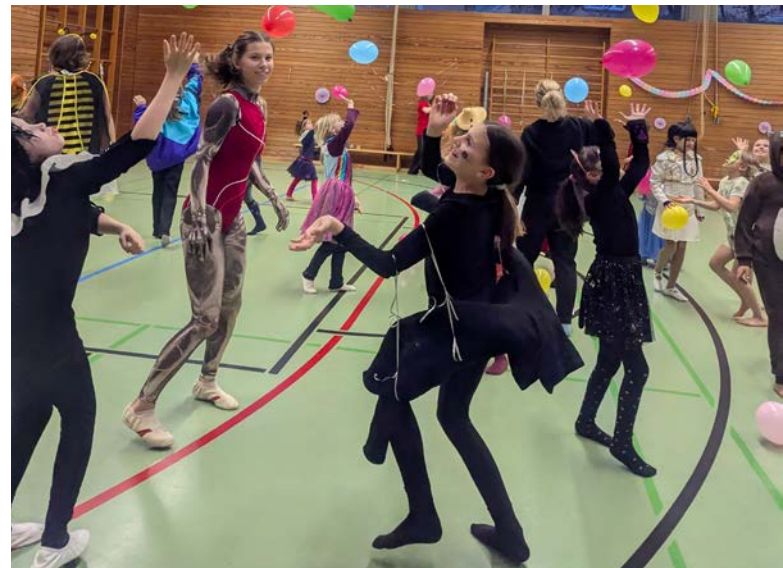
Spiel und Spaß