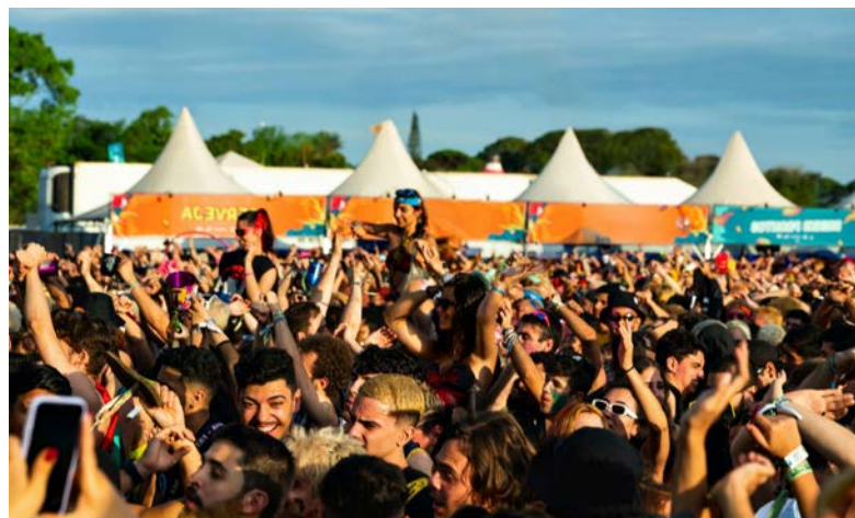
Party am SWR Fernsehturm am 25. Juli 2026

Ob aktiv an den Stationen, entspannt im Publikum vor der Bühne oder beim gemeinsamen Essen – der WaldauSommer lädt dazu ein, die Waldau neu zu entdecken und gemeinsam das Sommerwochenende zu erleben.