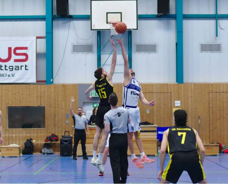
H1 im entscheidenden Spiel gegen Kirchheim Knights