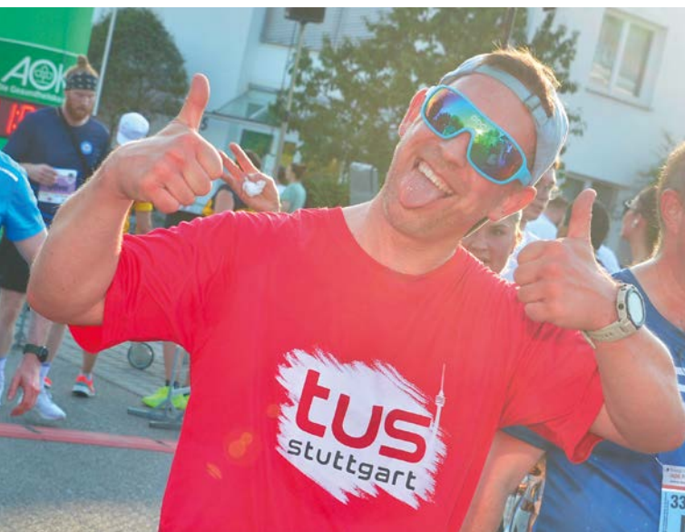
Das tus-Laufteam freut sich auf dich!

Unser tus 2 Rasenplatz wird zum Begegnungsraum für alle Generationen und Lebensformen. Mit buntem Rahmenprogramm und besonderen Highlights wie Drag Queens als Warm-up-Leiter*innen oder Streckenposten auf den Laufstrecken im Degerlocher Wald und auf der Bezirkssportanlage Waldau, zeigen wir, dass Queerness und Vielfalt positiv, offen und normal gelebt werden können.