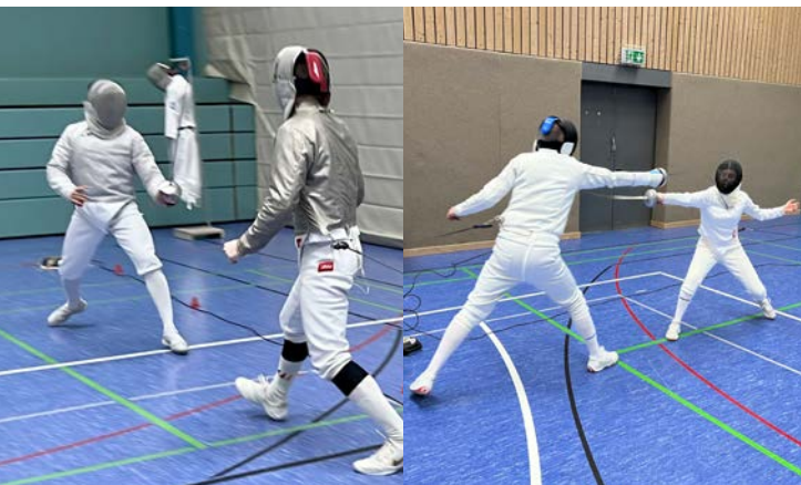
Arbeit an der Beinarbeit

Auch wenn andere die Füße hochlegten, wurde bei uns am 20. Februar 2026 fleißig weiter trainiert. Unsere Erwachsenen Degen- und Säbelfechter nutzten die schulfreie Zeit, um intensiv an ihrer Beinarbeit und Klingenführung zu feilen. Denn wie wir bei den Turnern gelernt haben: Die Vorbereitung ist alles, um auf der großen Bühne – oder eben der Planche – erfolgreich zu sein.