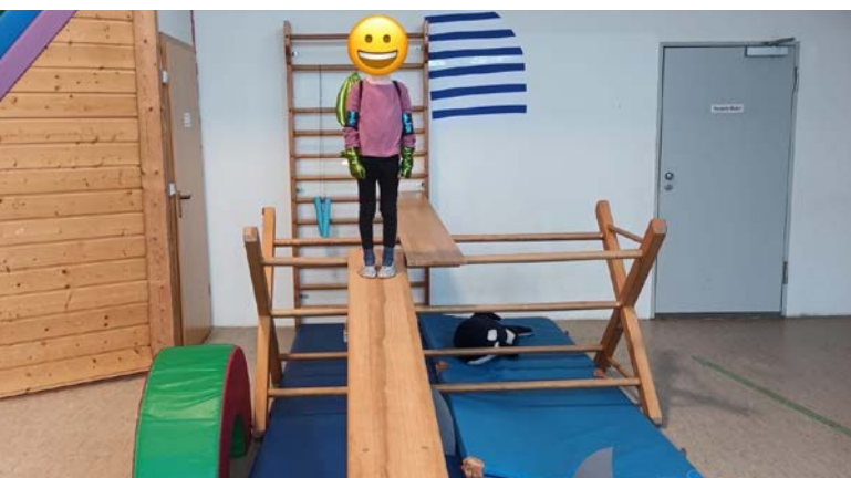
Ab auf die Planke

Hoher Wellengang im Toberaum, Konfetti im Haar und ein lautes „Ahoi!“ bis in die Garderobe: Im Sportkindi stand der Fasching dieses Jahr ganz unter dem Motto „Wir schippern übers Meer“. Und eines ist sicher – selten wurde hier so fröhlich über Teppichwellen gesegelt!