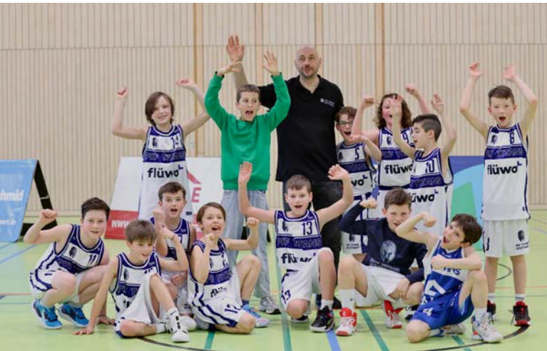
Die U10 hat wieder gewonnen