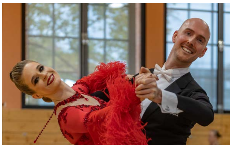
Erste Stuttgarter Tanzsporttage S. 57