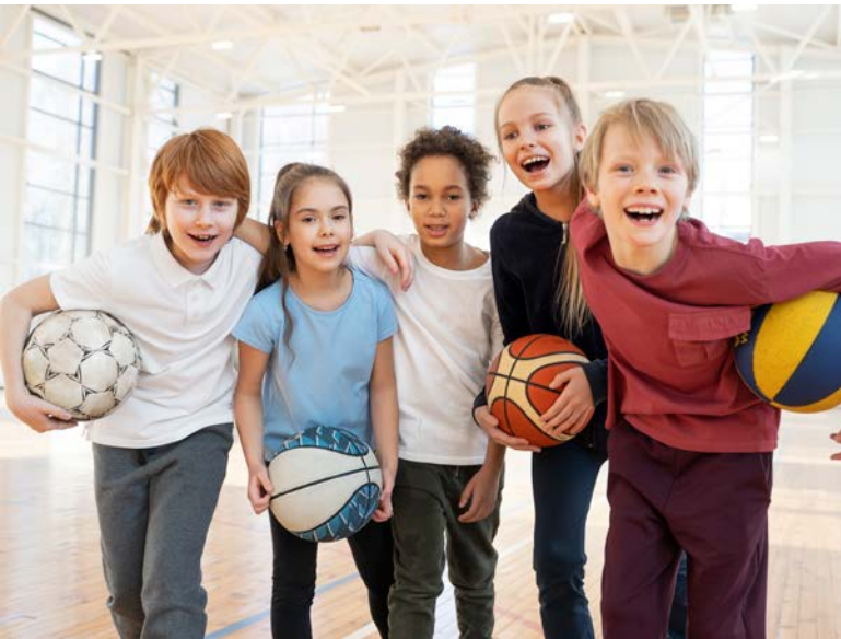
Bei den Sportwochen ist für alle etwas dabei

Im Jahr 2026 veranstaltet unsere Kindersportschule wieder Sport- und Fußballwochen für Kinder von 5 bis 12 Jahren. Hierbei werden verschiedene spielerische und sportliche Aktivitäten in der Sporthalle und auf dem umliegenden Gelände angeboten. Ein detaillierter Plan wird immer am ersten Tag der Sportwoche ausgehängt, sowie online gestellt. Genauere Infos und den Link zur Anmeldung finden Sie auf unserer Webseite unter kids|Sportwochen.