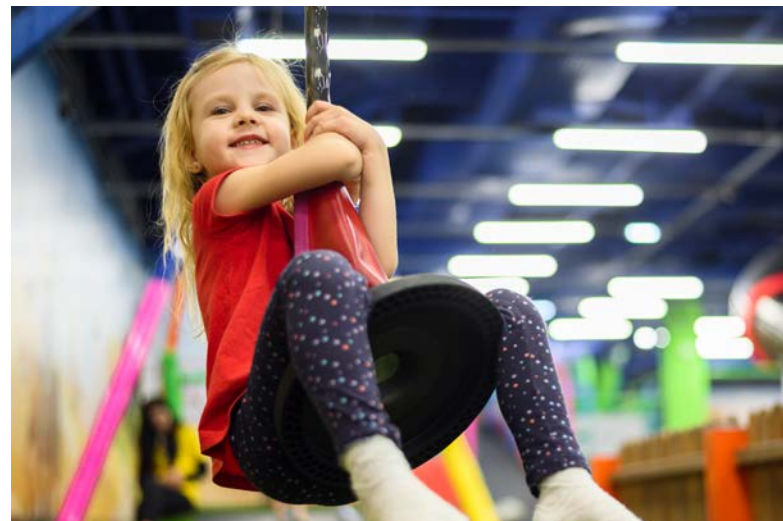
Austoben im TobePark

In den Schulferien findet der TobePark montags, donnerstags und freitags jeweils von 16:00–17:00 Uhr in der Ruth-Endress-Halle statt.