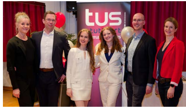
Die Sportlerinnen und Sportler des Jahres, Abt. Tanzen