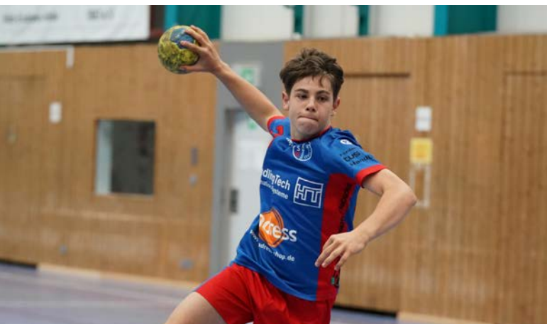
Dynamische Handballer im Anflug