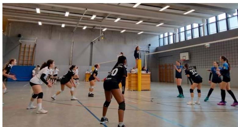
Die Volleyball Jugend in Feldkirch

Herzlichen Dank an alle Eltern und Trainer, die dieses Turnier möglich gemacht haben – euer Engagement ist unbezahlbar!