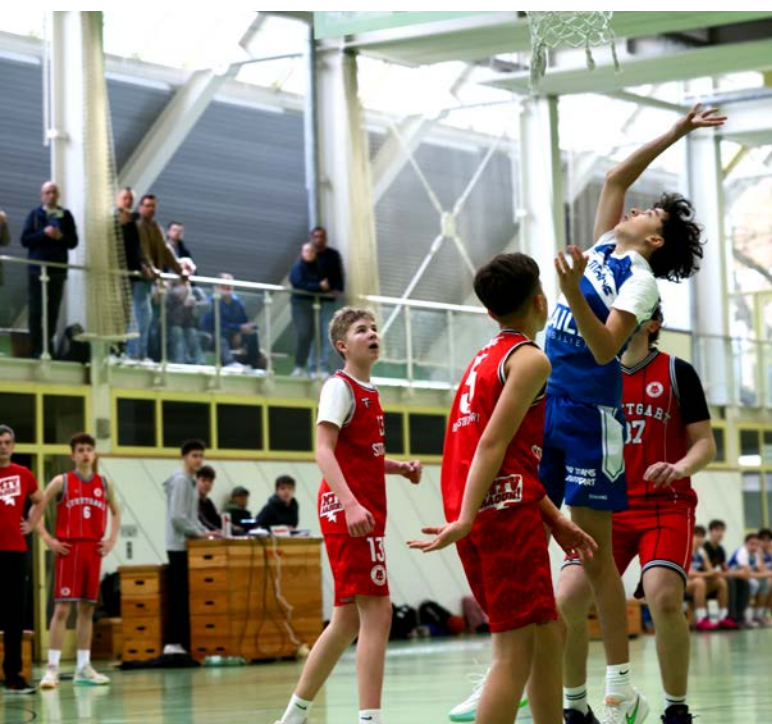
Die U14 im Einsatz

dest phasenweise auf Augenhöhe mitspielen kann. Hinter diesem starken Trio aus Ulm, Ludwigsburg und Karlsruhe kämpfen unsere Basketballer aber um den vierten Platz in der Regionalliga und alle anderen Teams wurden von den jungen Titanen bereits bezwungen.