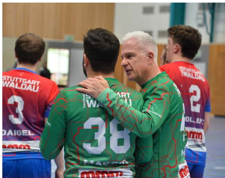
Ein gutes Miteinander ist oft entscheidend beim Handball