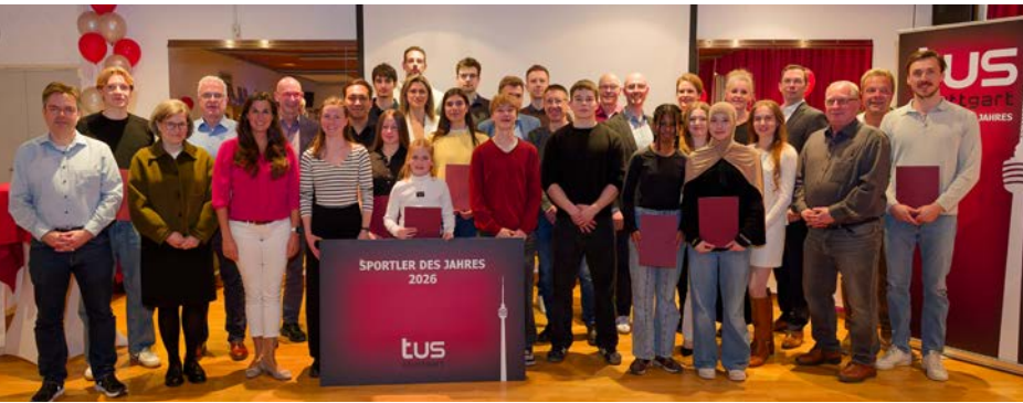
Die besten und engagiertesten Sportler und Sportlerinnen des Jahres des tus